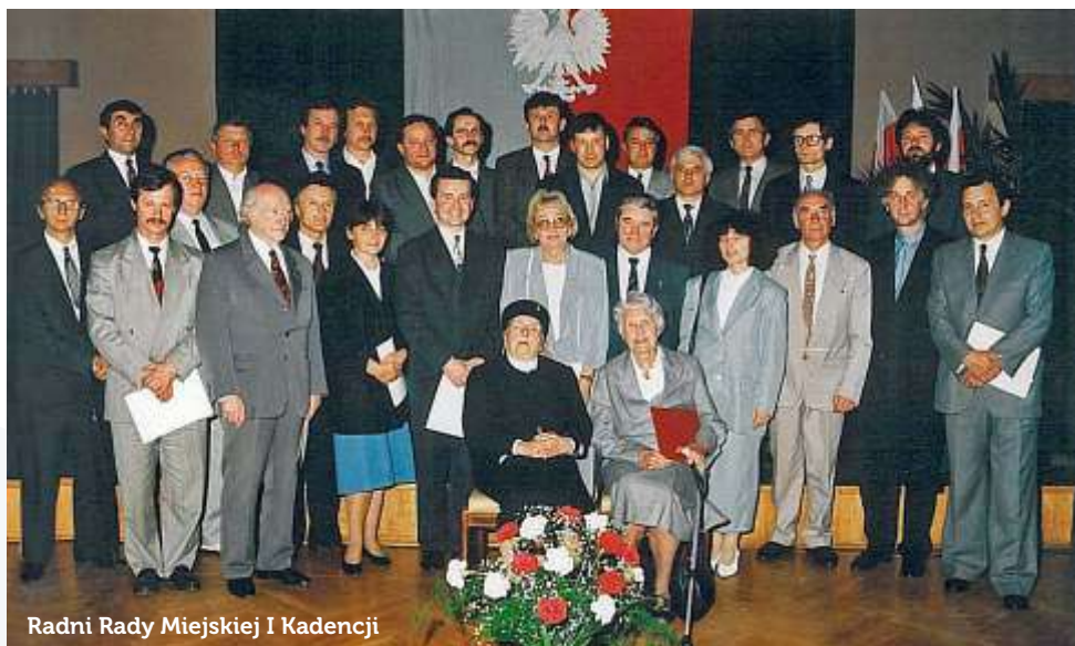
Radni Rady Miejskiej I Kadencji

- Widowisko słowno-muzyczne o historii Grodziska "500 plus czyli zgrany Grodzisk", godz. 19:00, Park Skarbków