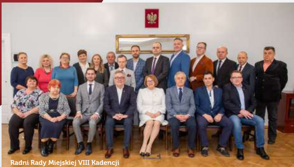
Radni Rady Miejskiej VIII Kadencji

Burmistrz Grodziska Mazowieckiego wraz z Radą Miejską